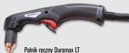
Palnik ręczny Duramax LT