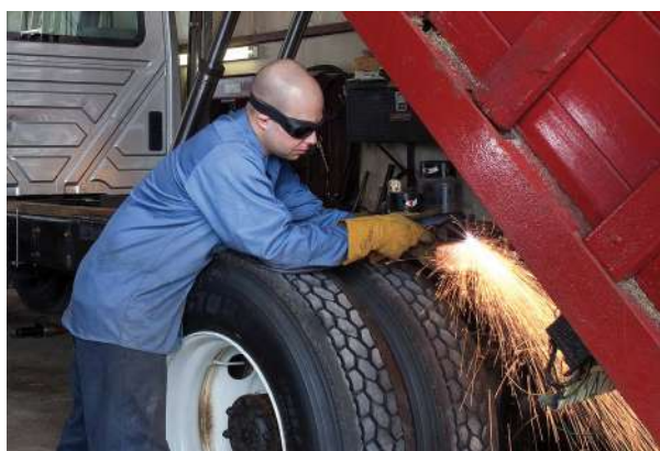
Naprawy i modyfikacje pojazdów